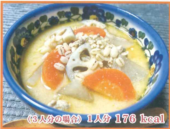
(3人分の場合) 1人分 176 kcal