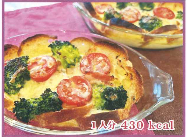
1人分 430 kcal